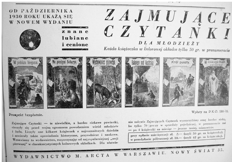
Fotografia 4. Reklama Wydawnictwa M. Arcta (fot. autorka)

Źródło: „Rodzina Polska” 1930, z. 10, s. 319.