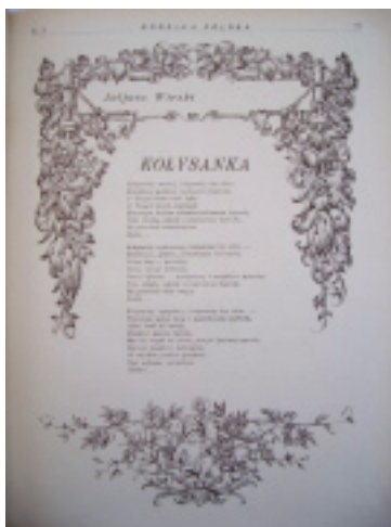
13. Ozdobnik tekstowy „RP”

Na odbiór pisma wpływ miały również piękne winiety, rozdzielniki i ozdobniki tekstowe. Ornamenty występowały wraz z poezją, a teksty rozpoczynano wyszukаныmi inicjałami. Pierwszą stroną tytułową zdobiła winieta przedstawiająca kwiaty wraz z informacją o dodatku. Własną winiętę oprócz strony tytułowej posiadały także działy Na falach czasu , Z księgi pielgrzyma i Dział kobiecy . Ostatni z nich zmienił winiętę o motywach kwiatów, na motyw dwu pawi oraz na ładniejszą z wizerunkiem młodej matki z dzieckiem od numeru sierpniowego z 1928 r. Kolejne lata przyniosły także zmianę winiety wstępnej (nr 10 z 1935 r.). Urozmaiceniu miesięcznika służyły również zeszyty z kolorowym drukiem: niebieskim (nr 11 i 12 z 1928 r.; 5 z 1929 r., 4 z 1934), brązowym (nr 1 z 1929 r., 3 i 8 z 1934), zielonym (nr 2 z 1929), fioletowym (nr 3 z 1929, 9 i 10 z 1934).