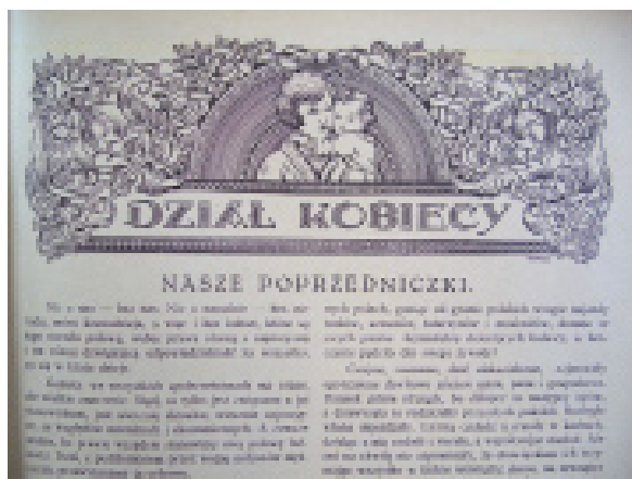
14. Nagłówek Działu kobiecego w l. 1928-1930