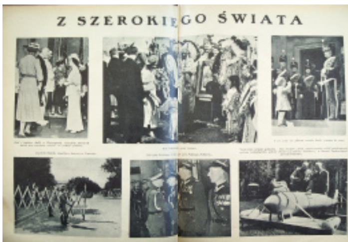
12. Dział ilustracyjny w „RP”

Przez cały okres wydawniczy pismo zawierało oprócz reprodukcji obrazów liczne czarno-białe fotografie. Zdjęcia miały charakter krajoznawczy, przyrodniczy, okolicznościowy, portretowy. Występowały początkowo w jednostronicowym cyklu Kraj w fotografiach artystycznych w 1927 r., a następnie od 1929 r. dwustronicowym dziale ilustracyjnym zatytułowanym Z szerokiego świata 48 .