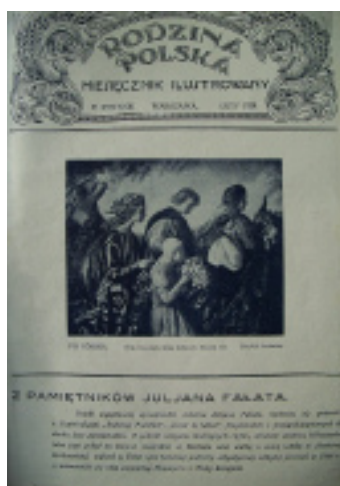
9. Strona tyt. „RP” nr 2 z 1928 r.