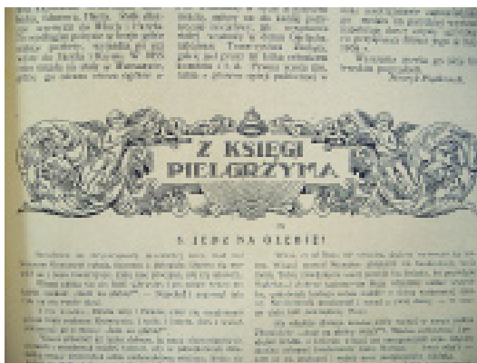
15. Winieta działu Z księgi pielgrzyma „RP” nr 3 z 1928 r.