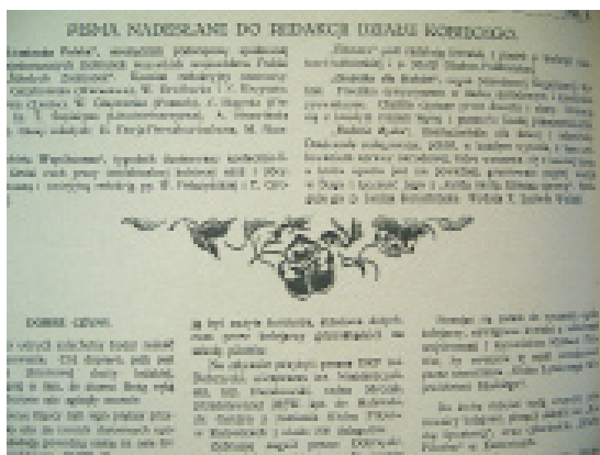
16. Ozdobnik tekstowy „RP”

Winiety i ozdobniki znacznie upiększały szatę zewnętrzną „Rodziny Polskiej”, nadając pismu walor estetyczny.