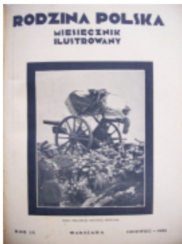
3. Okładka „RP” nr 6 z 1935 r.

skowy, sierpniowy – Jasną Górę , wrześniowy – Wrzesień na wsi przy pracy w polu, październikowy – motyw krajobrazowy. Przednia okładka w tymże roku nabrała również jednokolorowej tonacji granatowej, zielonej lub brązowej.