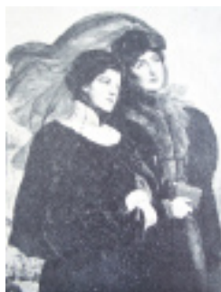
10. Dwie siostry W. Gersona „RP” nr 9 z 1927 r.