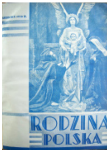
5. Okładka „RP” nr 12 z 1938 r.

W 1939 r. okładki nabrały elegancji zachowując nadal kilka kolorów. Przedstawiały w prawej przedniej części fotografie Watykanu (numer pierwszy), nowo wybranego papieża Piusa XII (numer czwarty), trójkę dzieci siedzących na polu przed przydrożną kapliczką, dziewczynę z dzbanem (siódmy). Zeszyt sierpniowy zamieścił fragment obrazu Stanisława Batowskiego „Atak husarii pod Wiedniem”. Okładka ostatniego numeru „Rodziny Polskiej” z września 1939 r. jest spokojna i nie zapowiada zbliżającej się wojny.