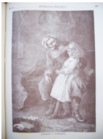
11. Dziadek i wnuczka „RP”

Przez cały okres wydawniczy pismo zawierało oprócz reprodukcji obrazów liczne czarno-białe fotografie. Zdjęcia miały charakter krajoznawczy, przyrodniczy, okolicznościowy, portretowy. Występowały początkowo w jednostronicowym cyklu Kraj w fotografiach artystycznych w 1927 r., a następnie od 1929 r. dwustronicowym dziale ilustracyjnym zatytułowanym Z szerokiego świata 48 .