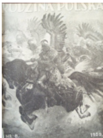
6. Okładka „RP” nr 8 z 1939 r.

Okładki miesięcznika zmieniały się i były bardzo urozmaicone. Redakcja starała się poprzez szczególną dbałość o nie przyciągnąć czytelników.