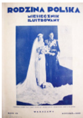
2. Okładka „RP” nr 1 z 1935 r.

Pierwszy rocznik „Rodziny Polskiej” posiadał raczej skromny wygląd. Nie wyróżniająca się niczym kartonowa jasnobieżowa okładka z tytułem i podtytułem pisma zawierała na środku drobny rysunek bukietu kwiatów w wazonie. Na dole okładki wytłoczono miesiąc, rok, miejsce i kolejny numer periodyku. Wykonawcą obwoluty i rysunków w tekście (winięt, ramek, ozdobników tekstowych) był E. Smidowicz.