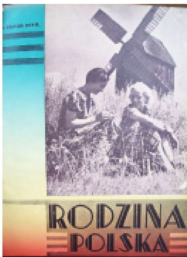
7. Okładka „RP” nr 9 z 1939 r.