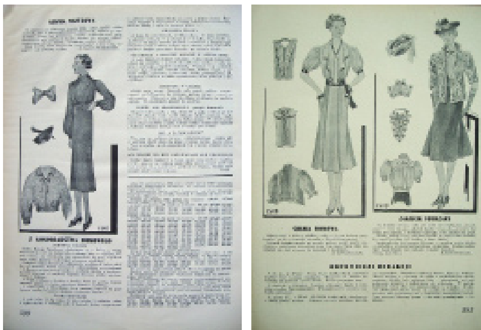
17. Moda w Dziale kobiecym „RP”