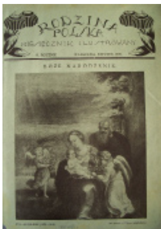
8. Strona tyt. „RP” nr 1 z 1928 r.